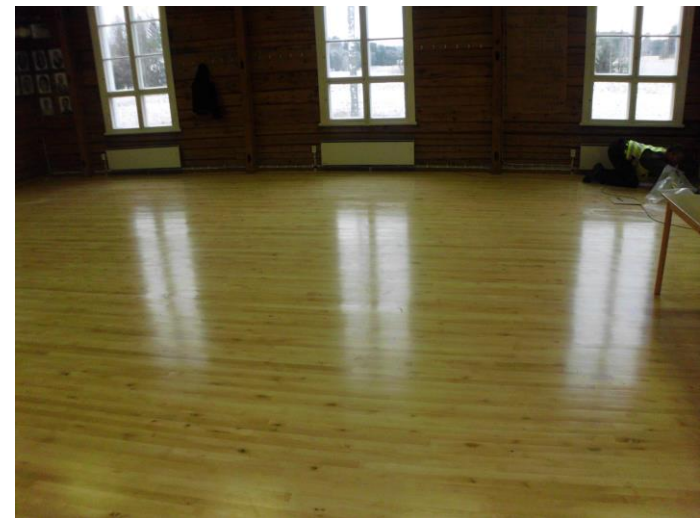
Uusi lattia valmiina