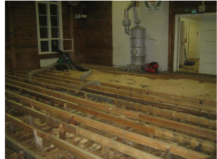
Vanhan lattian purku